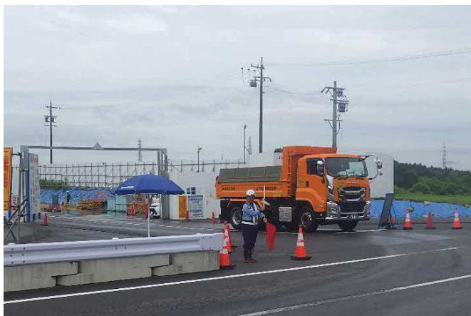
【進出入路仮設ゲート・発生土受入】