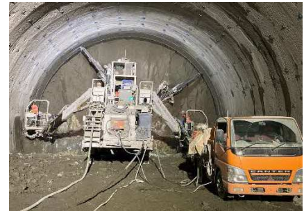
写真-1 ロックボルト打設状況

現在のトンネルの施工は、名古屋方へ掘削を進めている最中で、本坑の掘削が約100m（6月13日現在）進んでおります（本坑全長は約4,400m）（図-1参照）。右の写真は、ロックボルトの打設状況です。鋼アーチ支保工、吹付けコンクリート、ロックボルトといった支保工を組み合わせ、地山を支えながら、掘削を進めています。