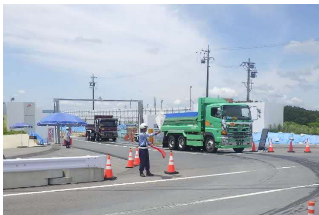
【進出入路仮設ゲート・発生土受入】