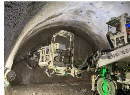
写真-1 本坑施工状況

大きさのイメージとしては、2車線の高速道路トンネルより一回り大きいトンネルです。