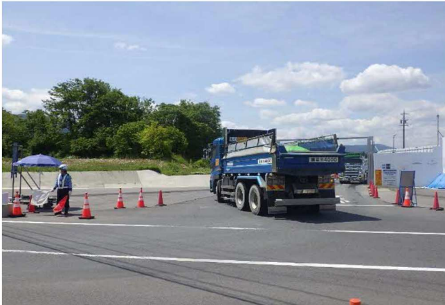
【進出入路仮設ゲート・発生土受入】