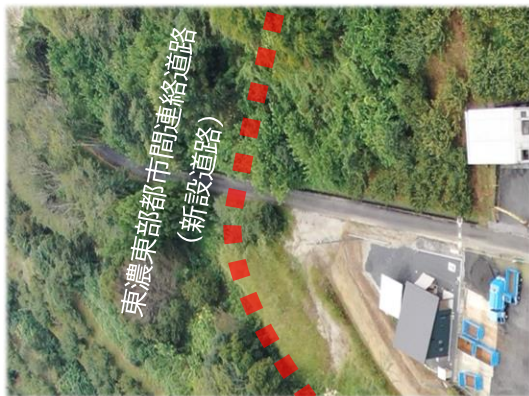
R4.9.15 時点 (着工前)