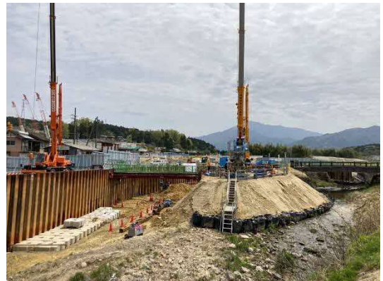
写真 河川切回し工 施工状況