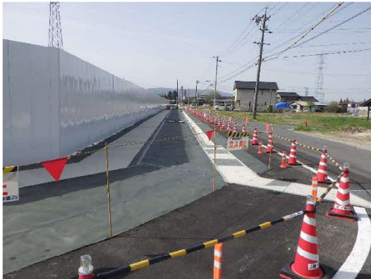
付替水路道路工事状況