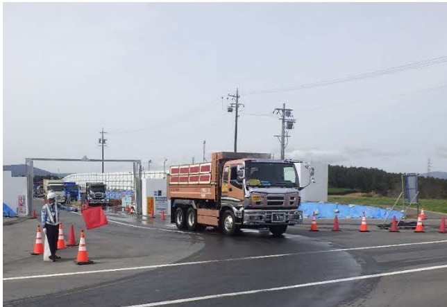
【進出入路仮設ゲート・発生土受入】