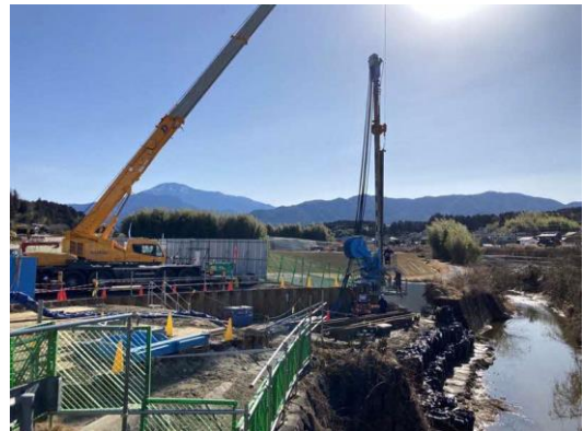
写真 仮付替河川 鋼矢板打設状況