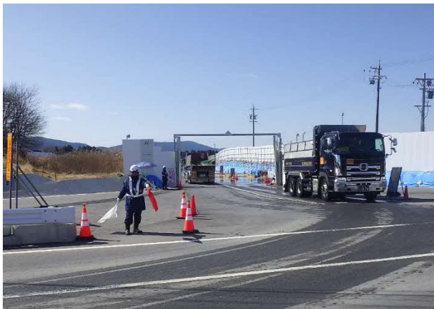
【進出入路仮設ゲート・発生土受入】