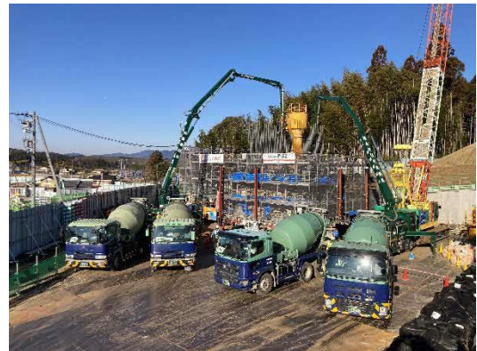
写真 ケーソン基礎 コンクリート打設状況