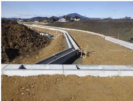
付替水路道路工事状況