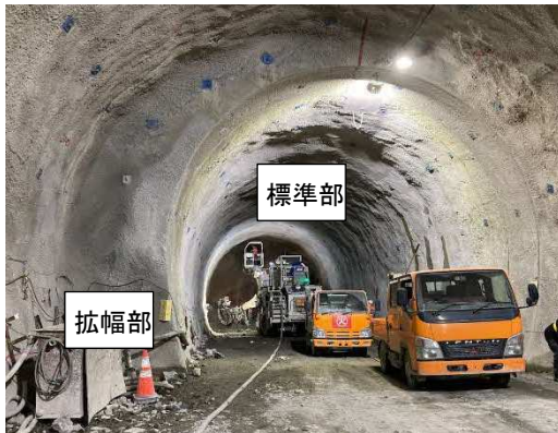
写真-1 拡幅部と標準部

写真は、拡幅部（手前）と標準部（奥側）の境界です。機械が離合するスペースを確保するため、拡幅部（延長約30m）を2箇所設けています。