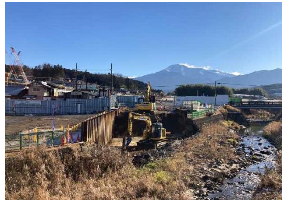
写真 仮付替河川 掘削状況