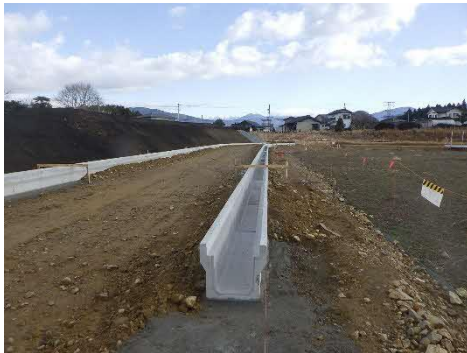
付替水路工事状況