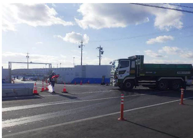
【進出入路仮設ゲート・発生土受入】