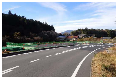
完成した三津屋地区ダンプ待避所