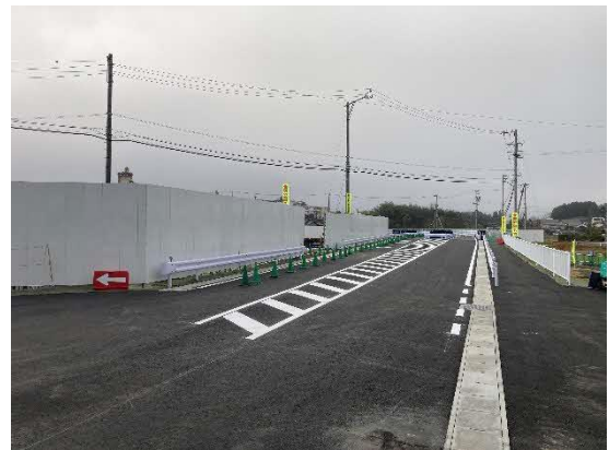
写真 県道410号線仮付替道路施工完了