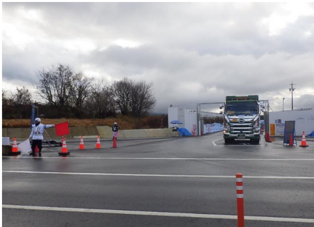
【進出入路仮設ゲート・発生土運搬】