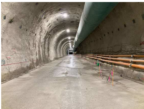
写真-1 トンネル内状況