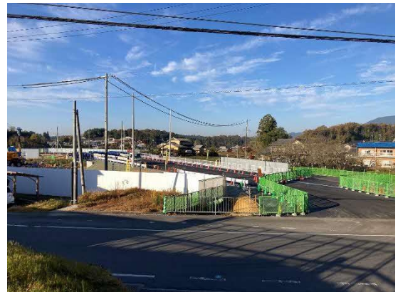
写真 県道410号線仮付替道路施工状況