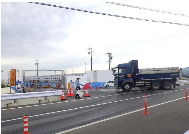
【進出入路仮設ゲート・発生土運搬】