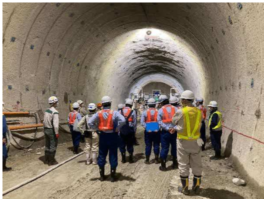
写真-1 現場相互点検状況

写真は、中津川市内で中央新幹線工事を施工している他の会社やJR東海による、現場相互点検状況です。いつもとは違った視点で、現場の安全を確認するという取り組みも行っています。