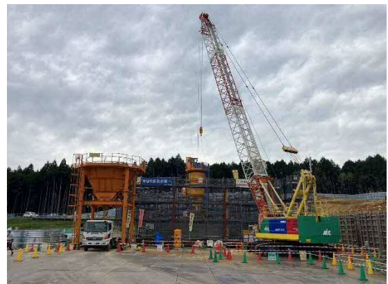
写真 ケーソン基礎工 沈下掘削状況