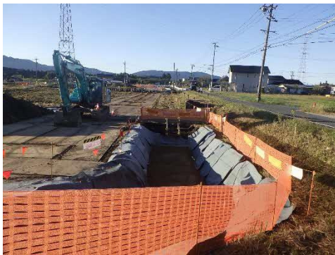
付替水路・工所用仮設道路状況