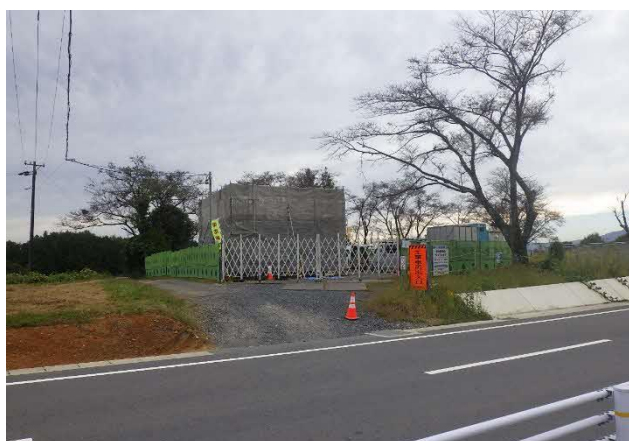
【揚水機場構築・設備設置】