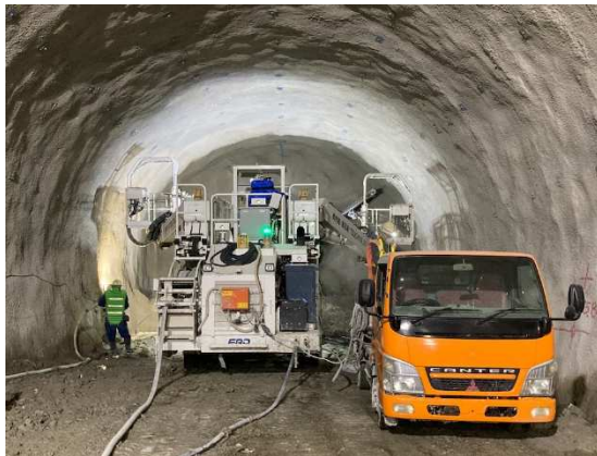
写真-1 ロックボルト打設状況

写真は、ドリルジャンボを使用して、ロックボルトという鋼棒を地山内に打ち込む作業をしている状況です。