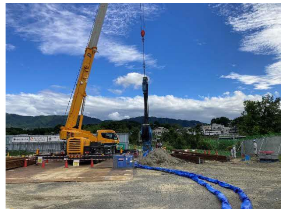
写真 河川切回し工 鋼矢板打設状況