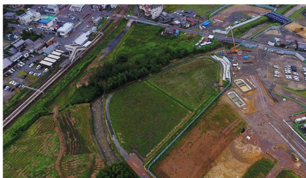
② 【状況写真 R4.9月時点】