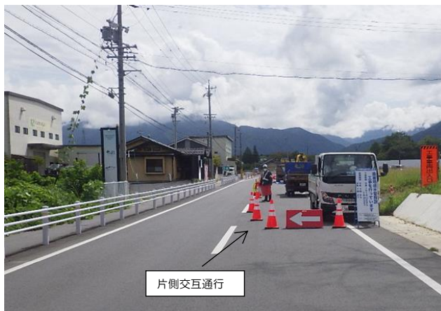
【坂本75号線・片側交互通行】