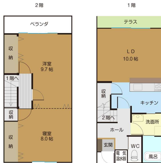
加子母UIターン者用住宅 須母田団地C棟