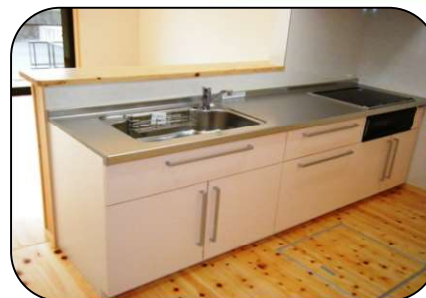
←オール電化キッチン