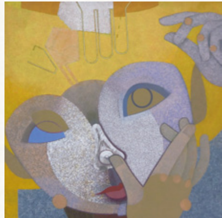
市長賞「テトテトカオト カオトテトテトプラン」

〈市長賞講評〉 質感の対比組み合わせ、色とマチエールの対比が効果的に使われていて大変素晴らしい作品となっています。