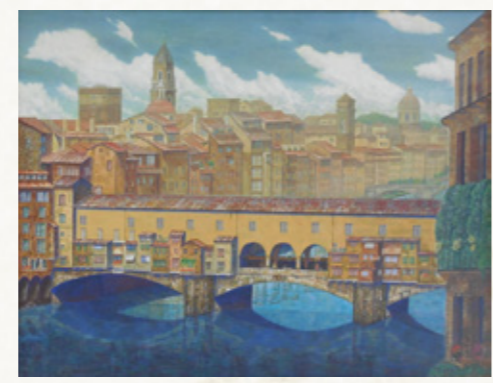
市長賞「心改新の橋」