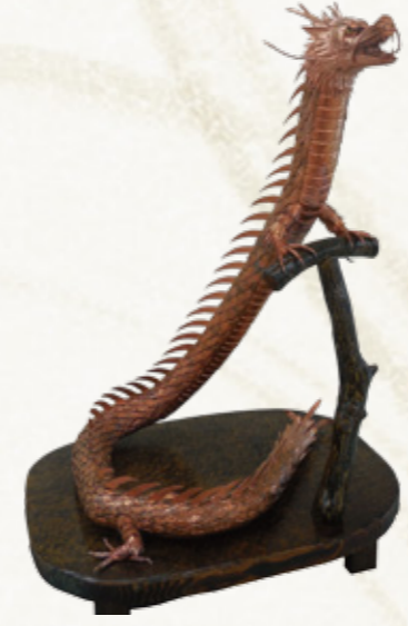
市長賞「龍の叫び(コロナ消え去れ)」

〈市長賞講評〉 龍の動きが実に躍動的に表現されており、迫力の有る作品に仕上がっている。金属でこのような曲線を表現するのは卓越した技術の裏付けがなければならない。台座をもう少しすっきりした物にした方が良いでしょう。