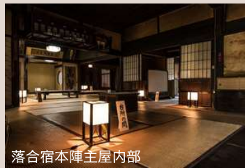
落合宿本陣主屋内部