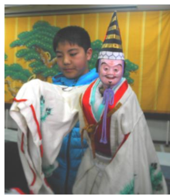
↑ 子供用の三番叟の人形を体験