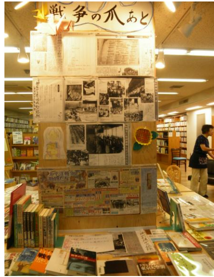
8月の展示は「戦争と平和」