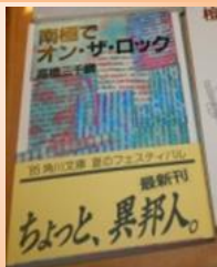
南極でオン・ザ・ロック 角川文庫