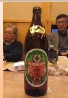
藤村の愛した桑酒は甘くておいしかった♪ H.N

♪速報です:2/13 第二次健康なかつがわ21パブリックコメント結果:▼「健康なかつがわ21」の普及と並行して図書館所蔵の本を紹介してはどうか」との意見に、『①健康情報の提供を図書館と連携して行っていきます。②情報提供の内容、方法に関しては、図書館所蔵の本の紹介も含め関係機関と検討を進めていきます。』と市が回答。