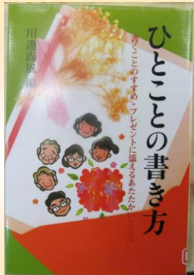
▼展示中の本全部貸出します

《中津川市読書による人づくりの基本条例(案)》 ▼一月十八日から二月一日に基本条例案のパブリックコメント募集。 ▼市の「読書による人づくり」の施策を条例で、裏打ちするもの。