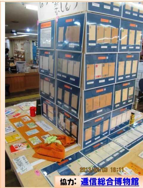
協力：通信総合博物館