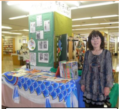
五月展示：世界の子どもの文化