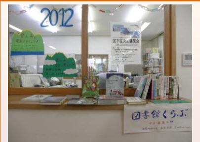
付知：五月 スイスの山の本展示♪