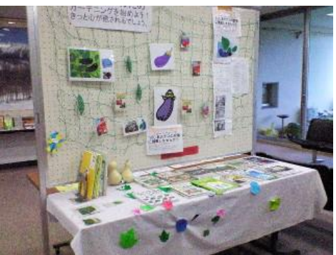
《山口公民館の展示》

▼「未来型公民館への7つの条件」(市図書館所蔵)の序章で、生涯学習は新たな投資だと指摘。序章のタイトルは「転換期における現代的課題と公民館」。▼「公民館展示」は「生涯学習投資」に大きな可能性をもたらす得ます。投稿K