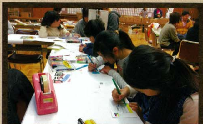
世界の国旗をプラ板で作ろう！