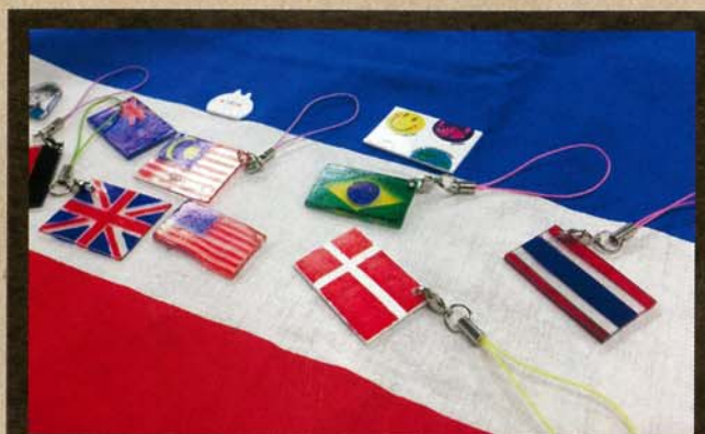
国旗キーホルダーが出来ました！