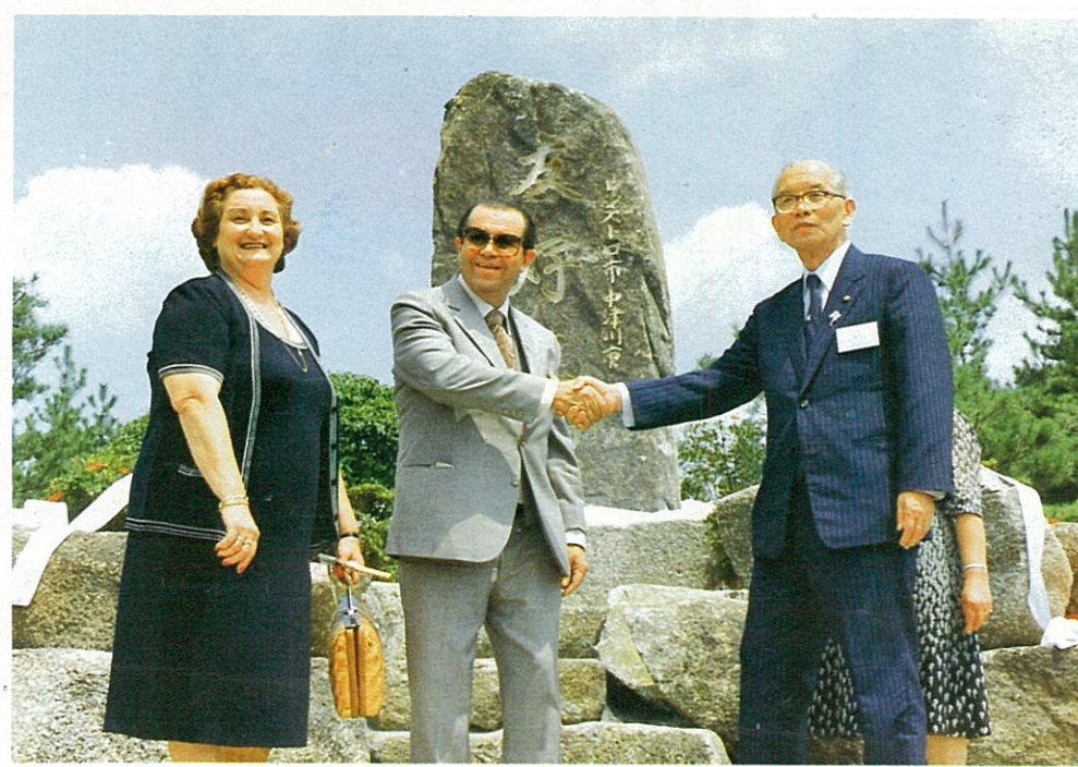
苗木夜明けの森友好の碑の前で、両市長堅い握手

さて、新年度を迎え新たに会員募集することになり、に会員募集することになり、に会員募集することになり、に