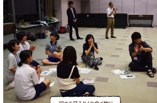
初めて見るタイの食べ物に皆興味深々！