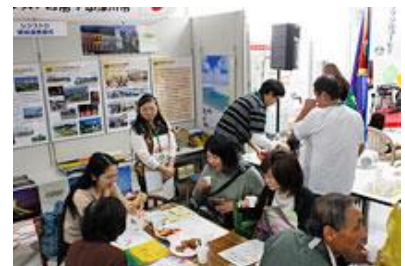
展示ブースの様子