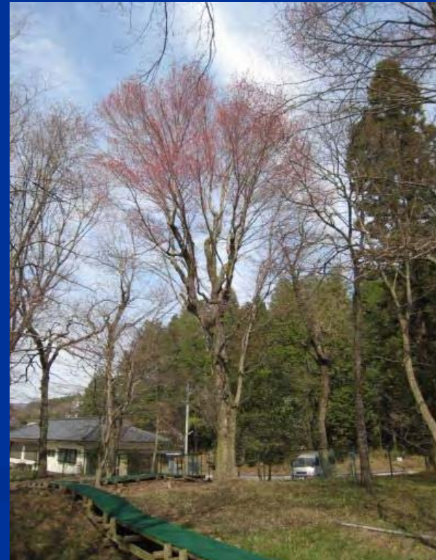
坂本のハナノキ自生地(国天然記念物)