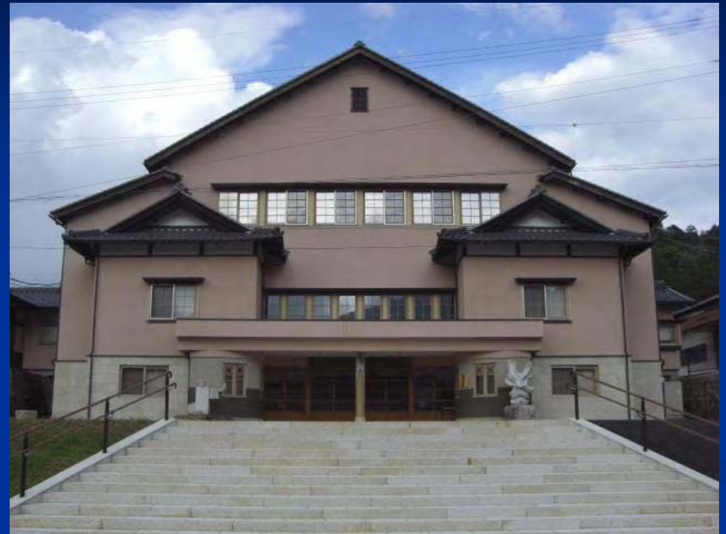
蛭川公民館(蛭子座)

中央公民館(中津)、苗木、坂本、落合、阿木、神坂、坂下、川上、山口、加子母、付知、福岡、蛭川の13公民館があります。