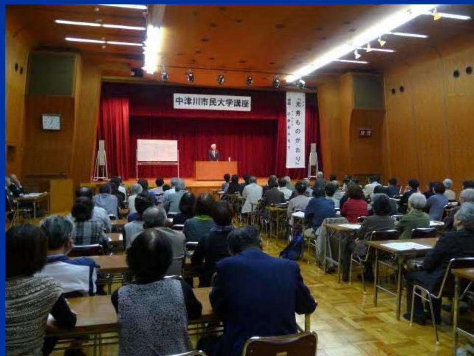
市民大学講座(中央公民館)