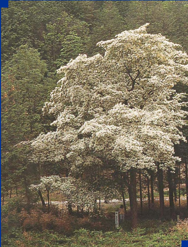
長瀬のヒトツバタゴ(国天然記念物)