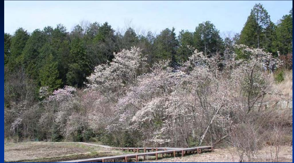
岩屋堂のシデコブシ群生地(県天然記念物)