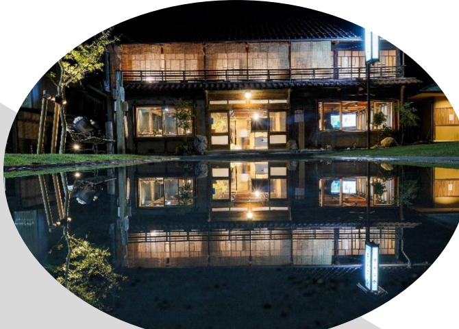
付知地域デザインミュージアム

中津川市では、自動運転ネットワークの導入と地域拠点整備等について東京大学大学院と共同研究を行っています。リニア時代に向けた新たな人の流れを創出するため、古民家等を改修した地域拠点の整備や、利便性の高い自動運転技術の活用について実証実験に取り組んでいます。