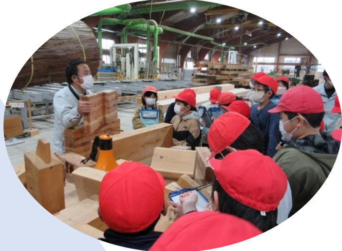
すご技なかつがわプロジェクトの様子

市内の「すご技」を持つ企業の訪問見学や出前講座で実際に働く人の話を聞く「すご技なかつがわプロジェクト」に取り組んでいます。