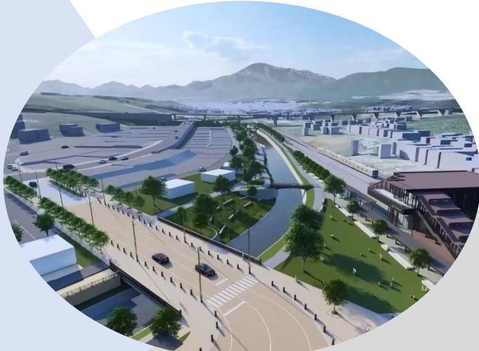
リニア駅周辺イメージ