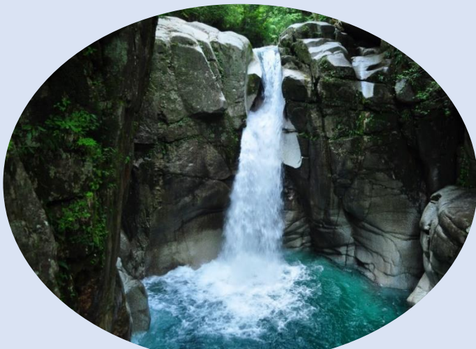
夕森公園「竜神の滝」