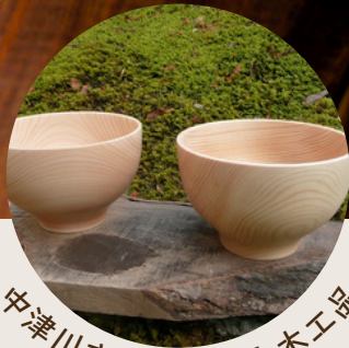
中津川市といえば！木工品