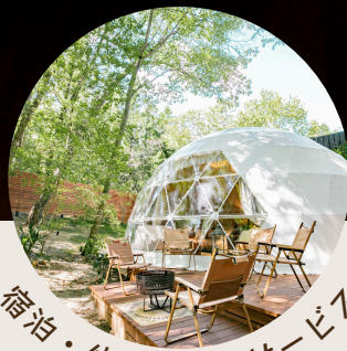
宿泊・体験などのサービス