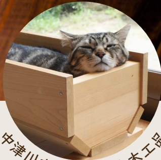
中津川市といえば！木工品