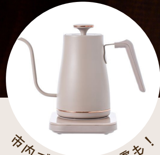
市内で作られた家電も！