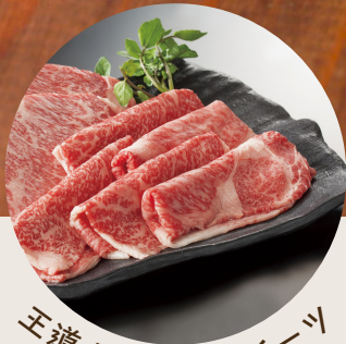
王道！お肉やスイーツ