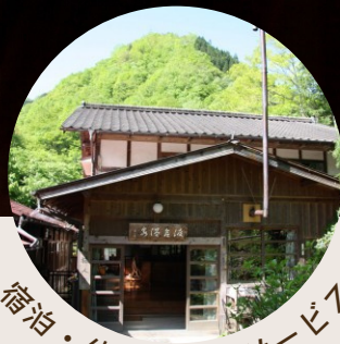
宿泊・体験などのサービス