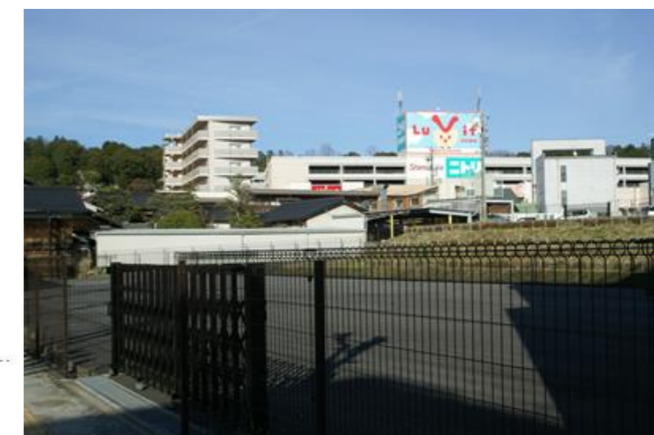
(北 道路側から撮影)